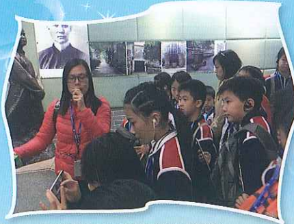
同學們用心聆聽導遊講解