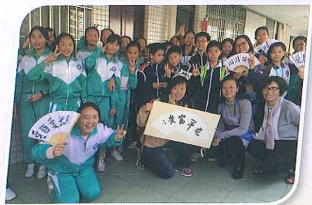
兩地同學樂也融融